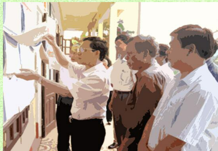
Người dân xem danh sách cử tri

- Người đang bị tước quyền bầu cử theo bản án, quyết định của Tòa án đã có hiệu lực pháp luật, người bị kết án tử hình đang trong thời gian chờ thi hành án, người đang chấp hành hình phạt tù mà không được hưởng án treo, người mất năng lực hành vi dân sự thì không được ghi tên vào danh sách cử tri.